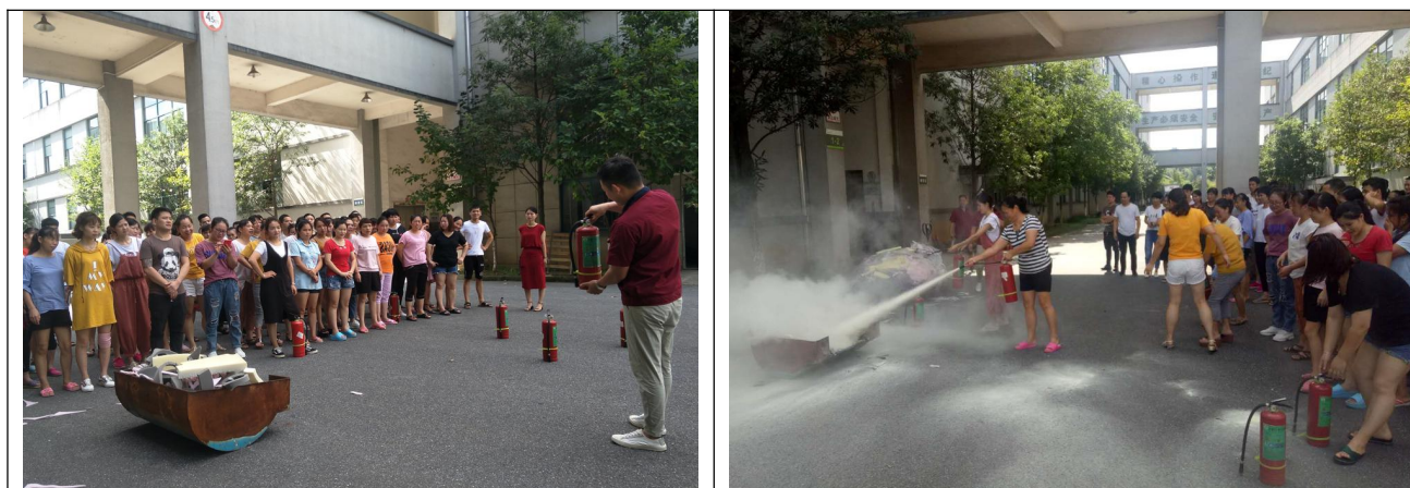
图 6.3-01 2020 年应急演练记录

为规范生产安全事故应急预案管理工作，迅速有效处置生产安全事故，依据《中华人民共和国突发事件应对法》、《中华人民共和国安全生产法》和《突发事件应急预案管理办法》等法规要求，公司制订了《生产安全事故专项应急预案》和《生产安全事故综合应急预案》。为了检验公司事故应急预案的合理性、实用性和可操作性；验证本公司应急体系及应急组织反应能力；锻炼各应急工作组和普通员工对应急知识、应急职责和应急程序等的熟知程度和实战能力；以便预案各种应急程序进一步掌握，磨合各应急工作组应急反应和协同应急处置能力。锻炼事故状态下，事故的有效收集和处置能力。测试公司应急反应和应急处置时间，暴露存在的问题，以便进一步完善应急预案和配备应急所需的设备器材。公司每年都会各类应急预案进行每年举行火灾消防、管道泄漏等各种应急预案的演练，演练后我们都会安排《应急演练评价》，总结演练，提出改进建议，不断地完善应急预案，更好地预防事故发生后应急措施的落实和有效性。