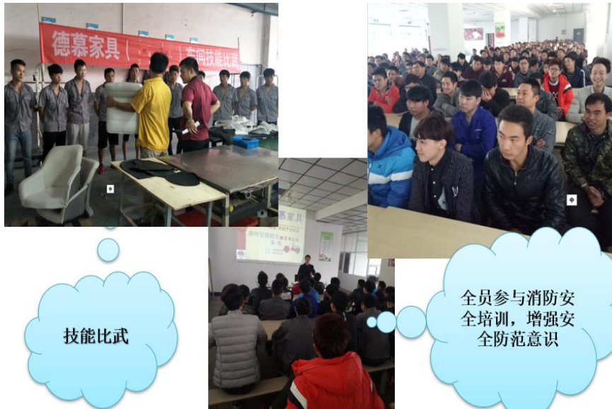
图 3.2-1 各类培训活动

公司每年针对实际和市场形势，识别各部门的培训需求，制定员工培训规划和年度计划，开展职工教育培训，包括质量意识、质量知识、管理制度、专业知识等培训内容。公司每年制定并下发了《年度培训计划》等，对质量诚信教育进行了安排布置。